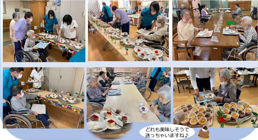
どれも美味しそうで迷っちゃいますね♪