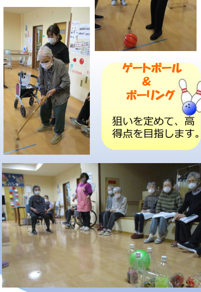
ゲートボール & ボーリング 狙いを定めて、高得点を目指します。