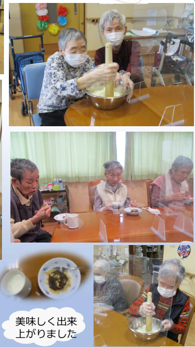
美味しく出来上がりました